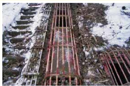
取水ゲートの劣化状況