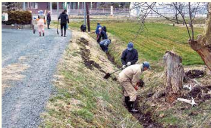
地域住民による堰堀の様子

管内各地で水路保護組合等を中心に小用排水路の浚渫（堰堀）などの管理が行われておりますが、昨今農家の高齢化等により作業する人が集まらないというお話しをお聞きします。