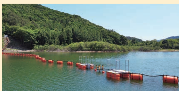
新設された網場 あば