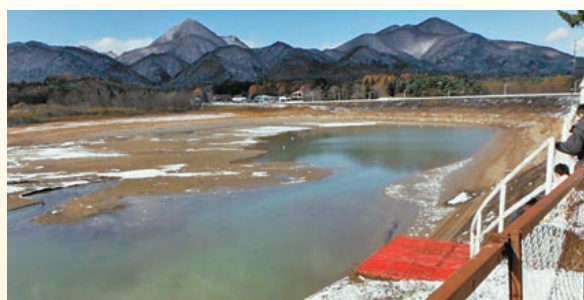
堆砂除去前の煙山ダム