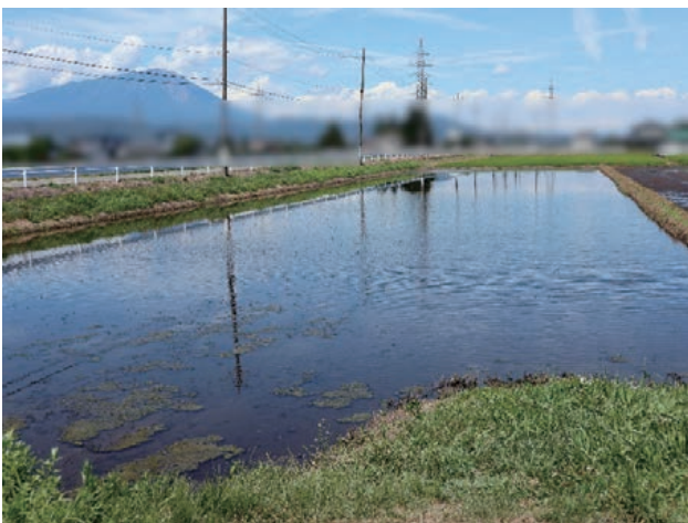
渇水時に水張りしていた転作田