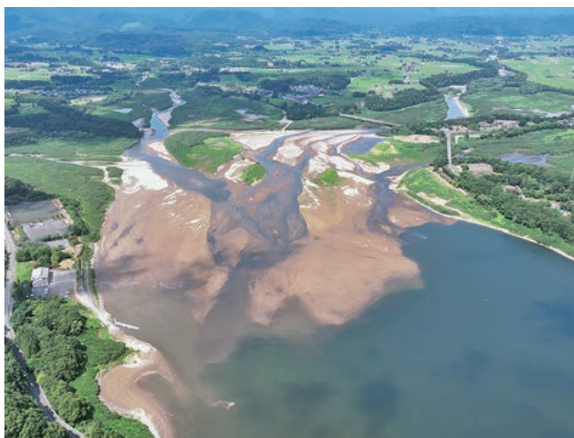
上流側で堆砂があらわになった御所ダム

なお、ダムの補給措置は特例的なものでもあり、関係利水者等の合意やダムの貯留水の状況しだいでは実施できないこともありますので、引き続き農業用水の節水にご協力いただきますとともに、今後も管内全域で水不足が見られるような場合は番水を実施することがありますので、その際はご理解とご協力をお願いいたします。