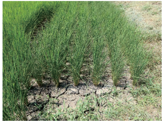
枯死のおそれがあった水田

出穂期など水が重要な時期にかけ流しを見つけた場合、水口又は給水栓を閉めさせていただきます。また、今年のような渇水傾向の中で過剰な取水が繰り返される場合は路線全体の用水を停止する対応をとらせていただくこともあります。