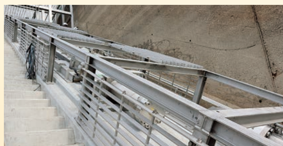
改修後の取水ゲート