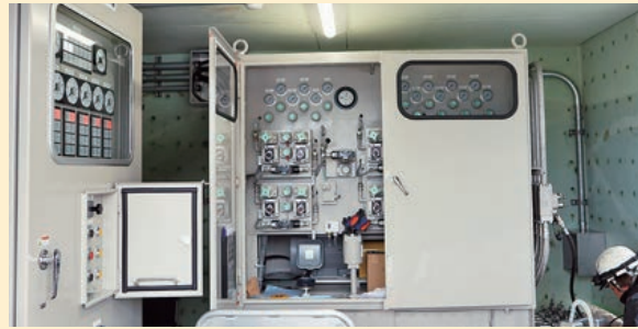
新設された機械操作盤