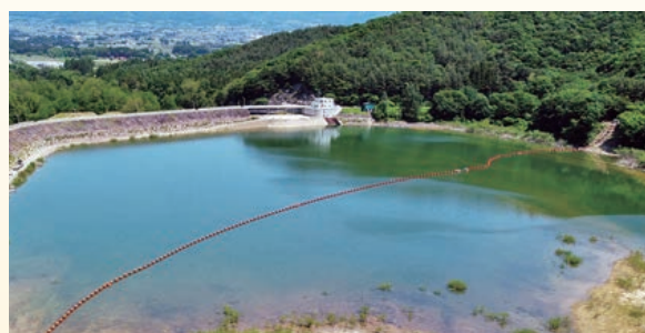
改修後の煙山ダム