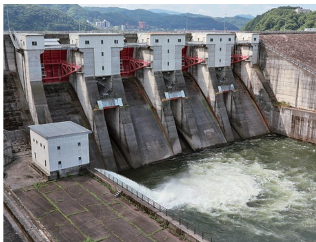
ゲート脇のバルブから放流される異常渇水補給の様子