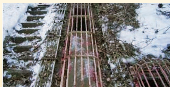
改修前の取水ゲート