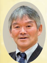
鹿妻穴堰土地改良区

さて、管内の土地改良事業につきましては、令和元年度から着工いたしました国営施設応急対策事業「雫石川沿岸地区」による煙山ダムの改修整備を終え本年度をもって事業完工を迎えます。