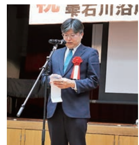
来賓祝辞を述べる鷲野部長

祝賀会には東北農政局農村振興部長鷲野健二様をはじめとする関係者約90名が出席し、事業の完了を祝うとともに、今後の地域農業の持続的な発展に向け思いを新たにしました。