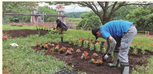
活動団体と活動施設

平成16年度から開始したアドプト活動は今年で23年目を迎え、現在は12施設24団体まで増えております。今後も土地改良施設の清掃、緑化作業を実施していただける団体を広く募っております。参加希望の団体は当土地改良区までお問い合わせください。