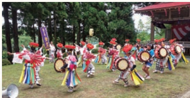
盛岡さんさ踊り清流

日時 令和8年8月30日(日) 午前11時予定 場所 盛岡市猪去田面野木46 鹿妻神社境内