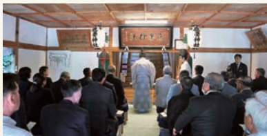
令和7年鹿妻神社例祭の様子