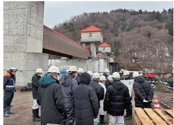
当区役員現地視察の様子

鹿妻穴堰頭首工は造成から50年以上経過しておりますが、本事業により施設機能の保全と耐震化が図られ、これからも地域農業の重要施設とし安定した農業用水の供給を維持してまいります。