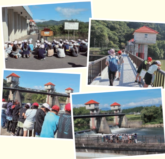
令和7年度見学に来ていただいた団体

また、出前授業も随時受け付けしておりますので、ご希望の方はお問い合わせください。